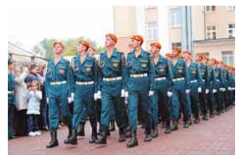
Сентябрь 2013 года – принятие присяги первокурсниками