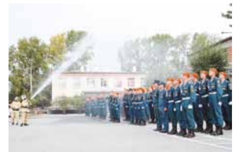
Август 2013 года – вручение оранжевых беретов

С друзьями расставаться жаль, всем огромное спасибо за понимание и поддержку. Будем встречаться как можно чаще, чтобы не забывать друг друга.