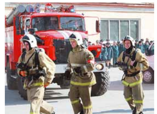
Март 2017 года – выпускной курс факультета пожарной безопасности участвует в командно-штабных учениях на тему: «Действия пожарно-спасательных подразделений по тушению пожаров на объектах с массовым пребыванием людей»