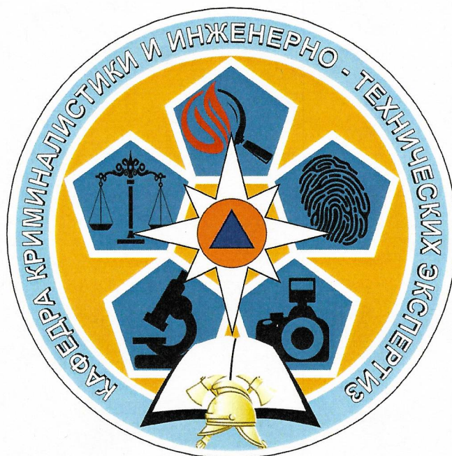
Рис. Графическое изображение логотипа кафедры

Логотип кафедры криминалистики и инженерно-технических экспертиз (в составе учебно-научного комплекса обеспечения пожарной безопасности объектов и населенных пунктов)