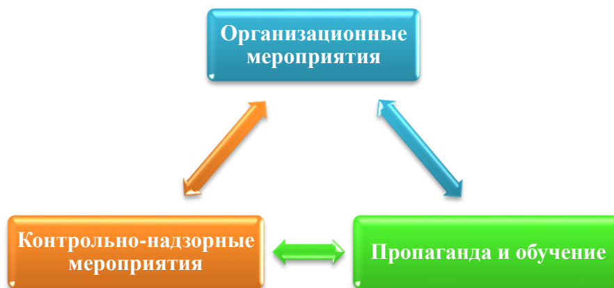
Рисунок 2. Группы профилактических мероприятий в жилом секторе

1. Организационные мероприятия (рис. 3) включают подготовку информации инспектором ГПН о состоянии закрепленного за ним объектов жилого сектора и находящихся в его ведении объектов воздействия.