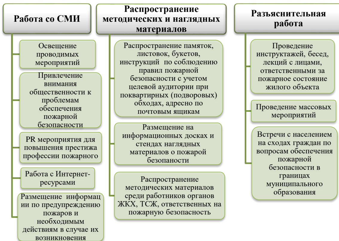
Рисунок 5. Пропагандистские и обучающие мероприятия