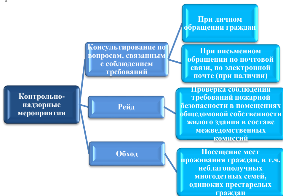
Рисунок 4. Контрольно-надзорные мероприятия за соблюдением требований пожарной безопасности в жилом секторе

2. Контрольно-надзорные мероприятия за соблюдением требований пожарной безопасности в жилом секторе (рис. 4). Осуществляются в отношении лиц, ответственных за безопасное состояние жилого сектора: собственников жилья, представителей товариществ собственников жилья (ТСЖ), руководителей органов местного самоуправления, жилищно-коммунального хозяйства, председателей садоводческих, огороднических некоммерческих товариществ (СНТ).