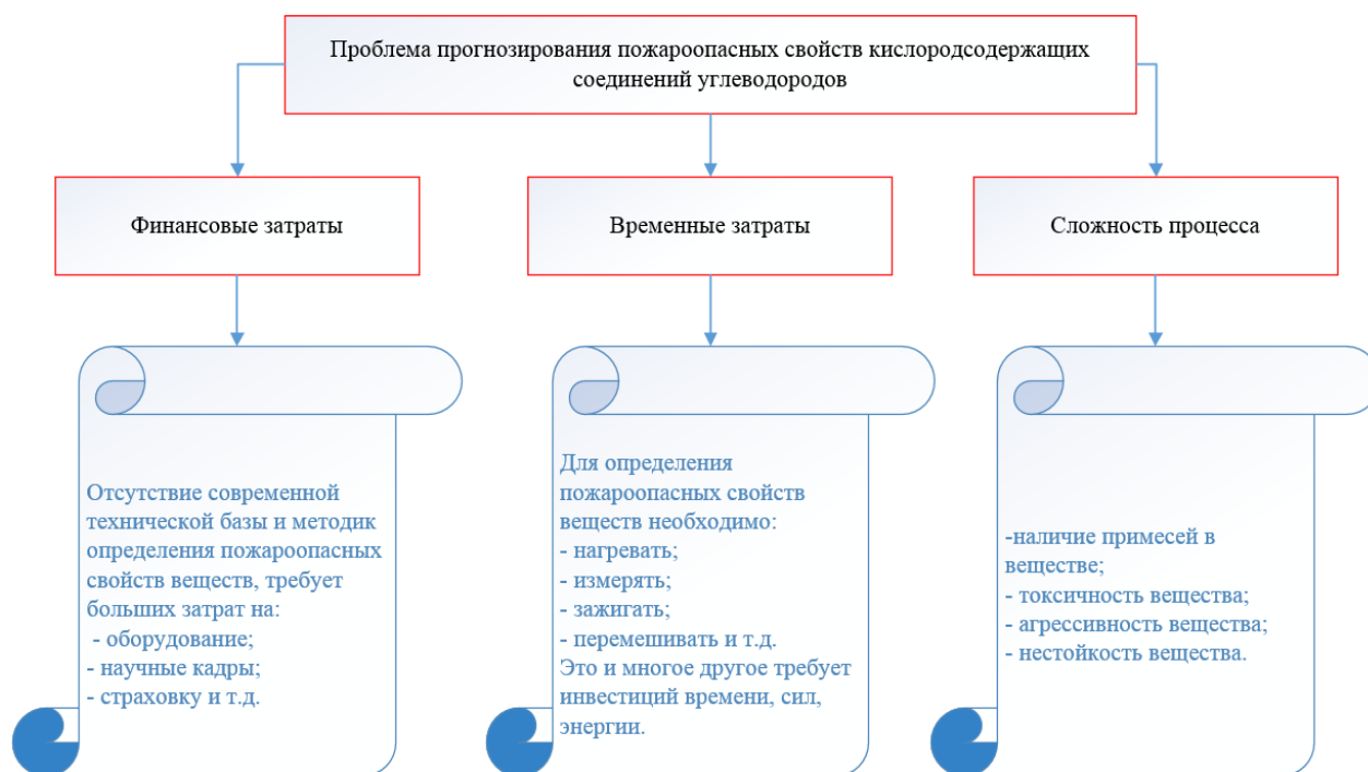
Рисунок 3. Основные проблемы прогнозирования пожароопасных свойств

риалов, ограничение массы или объема горючих веществ и т.д., только отсутствие сведений о физико-химических свойствах вещества, применяемых в производстве, становится существенным препятствием для их использования. Это связано в первую очередь с тем, что с каждым годом количество органических соединений увеличивается на 250-300 тыс., а экспериментальное определение пожароопасных свойств веществ сопряжено с рядом осложняющих факторов (рисунок 3).