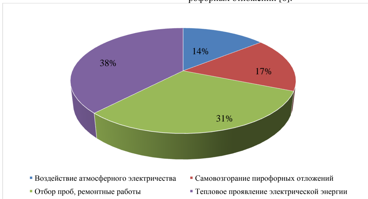
Рисунок 2. Распределение основных источников зажигания на предприятиях нефтегазовой отрасли

Так, согласно статистике МЧС России за 2017 год (рисунок 2) основными причинами пожаров на производственных объектах, в частности нефтегазовой отрасли, являлись: тепловое проявление электрической энергии, воздействие атмосферного электричества, отбор проб, ремонтные работы, самовозгорание пиррофорных отложений [6].